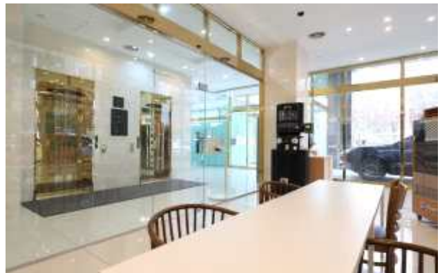
창업 카페, 밀키트 마켓