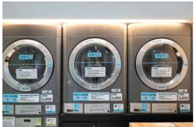
대형 세탁기, 대형 건조기